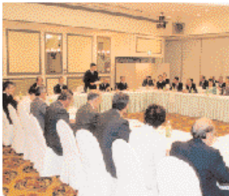
16年度事業計画案や予算案などを審議する協議会委員の皆さん

て、県知事は県議会に1市4町の合併議案を提案します。県議会で可決されれば、県知事による合併の決定処分が行われ、総務大臣に届出がなされます。この届出を受け総務大臣がこれを告示することによって、来年2月5日に新「久留米市」が誕生します。