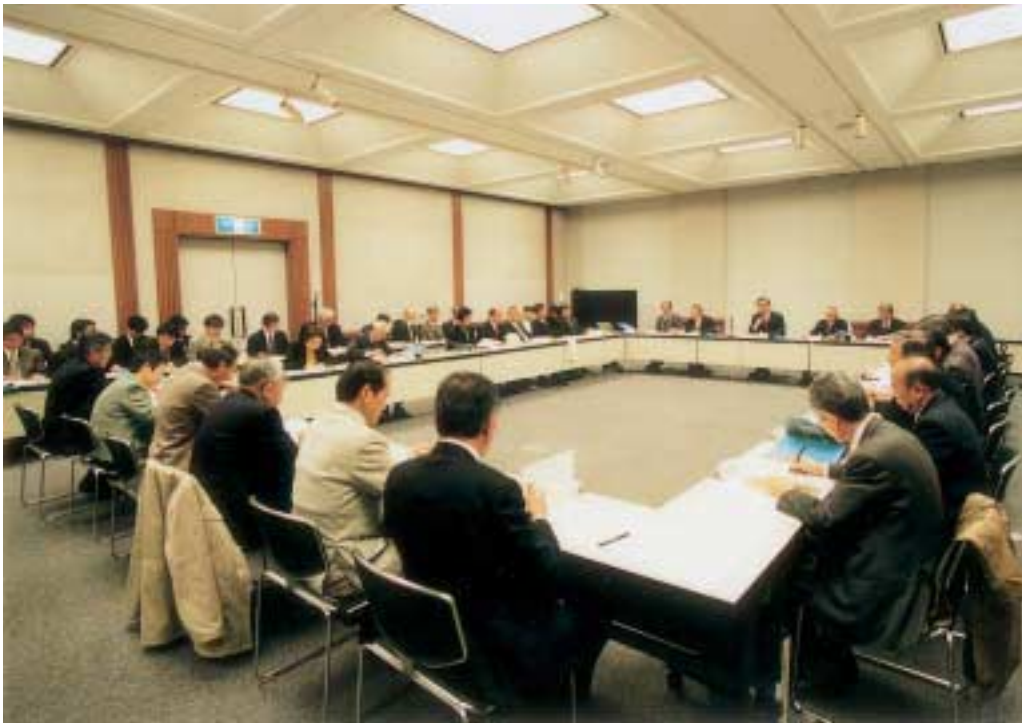
▲平成14年度事業計画や協議会組織などについて熱心な協議が進められた第1回協議会

久留米市、田主丸町、北野町、城島町、三潯町の1市4町で合併を協議する「久留米広域合併協議会」第1回協議会が、1月17日久留米市庁舎でありました。久留米広域合併協議会は県内5番目の法定協議会ですが、任意協議会から移行のはじめてのケースになります。