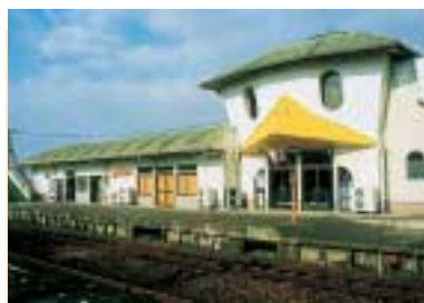
田主丸ふるさと会館 (JR田主丸駅)