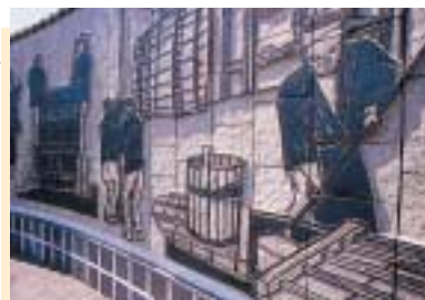
酒造りのレリーフ (町民の森公園)