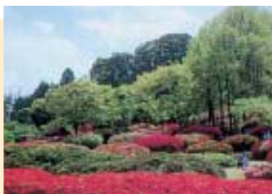
久留米森林つつじ公園